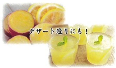
デザート作りにも！