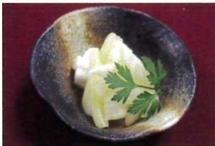
漬けこむだけで簡単浅漬け！