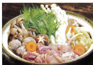
鍋にももちろん合います！