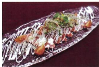
カルパッチョにも！